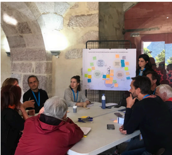
Formation des élus - Mont-Dauphin, 2023

« Une gouvernance basée sur un groupe de partenaires et un pool d'experts, c'est rare et stimulant ». Territoire TETRAA