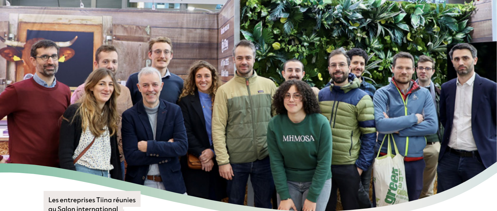
Les entreprises Tiina réunies au Salon international de l'Agriculture, à Paris sur le stand de la Ferme digitale.